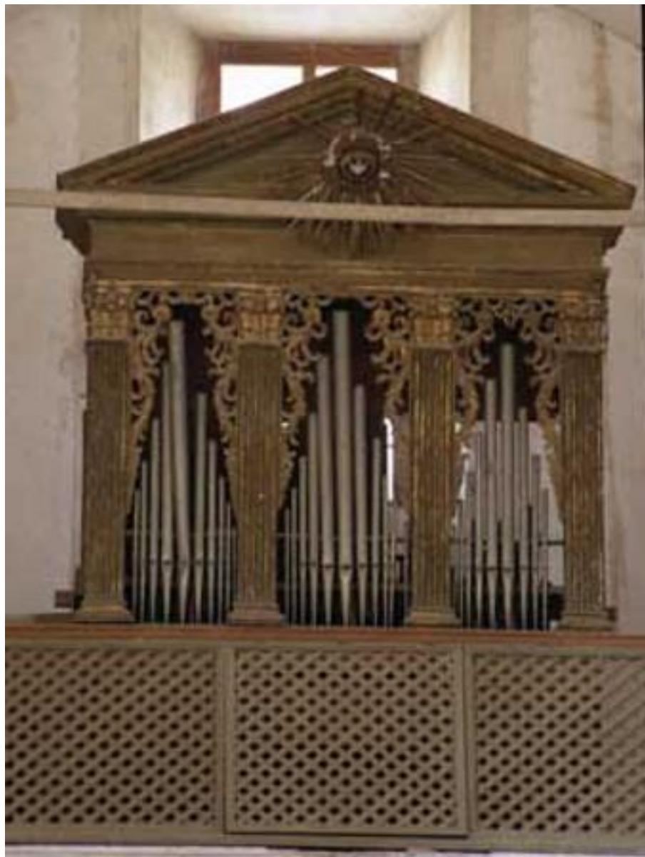
XIX SECOLO ORGANO LEGNO E PIOMBO, CM 350x200 155433[39]