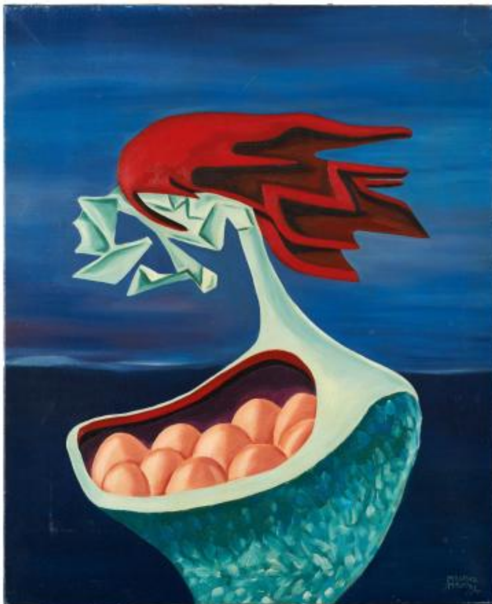
MAURICE HENRY (1907 - 1984) LES OEUFS DU VENT DIPINTO OLIO SU TELA, CM 61x50 155457[2]