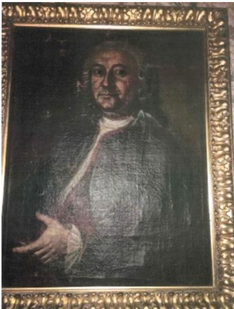
ANONIMO DEL XVII SECOLO RITRATTO DI NOBILUOMO DIPINTO OLIO SU TELA 155501[1]