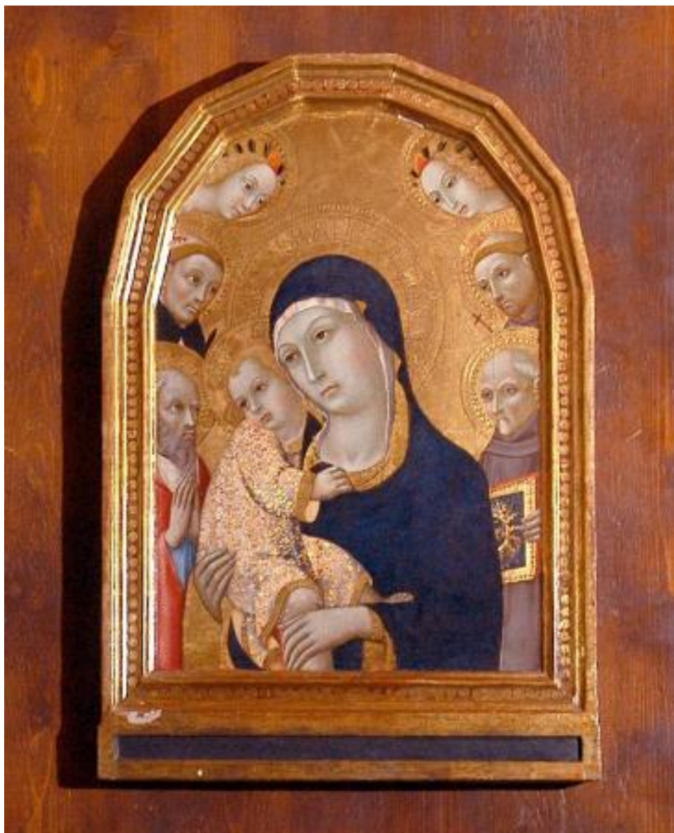
SANO DI PIETRO (1406 - 1481) MADONNA CON BAMBINO, SANTI GEROLAMO, BERNARDINO, FRANCESCO E PIETRO MARTIRE DIPINTO FONDO ORO SU TAVOLA, CM 74x51 154308[7]