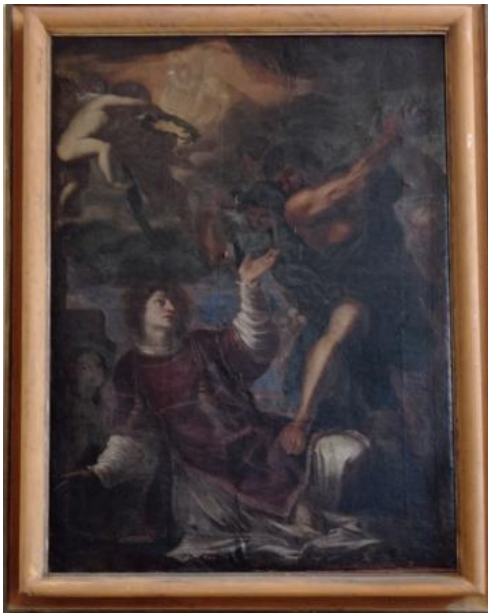
MATTEO ROSSELLI (1578 - 1650) IL MARTIRIO DI SANTO STEFANO DIPINTO OLIO SU TELA, CM 260x210 154925[4]