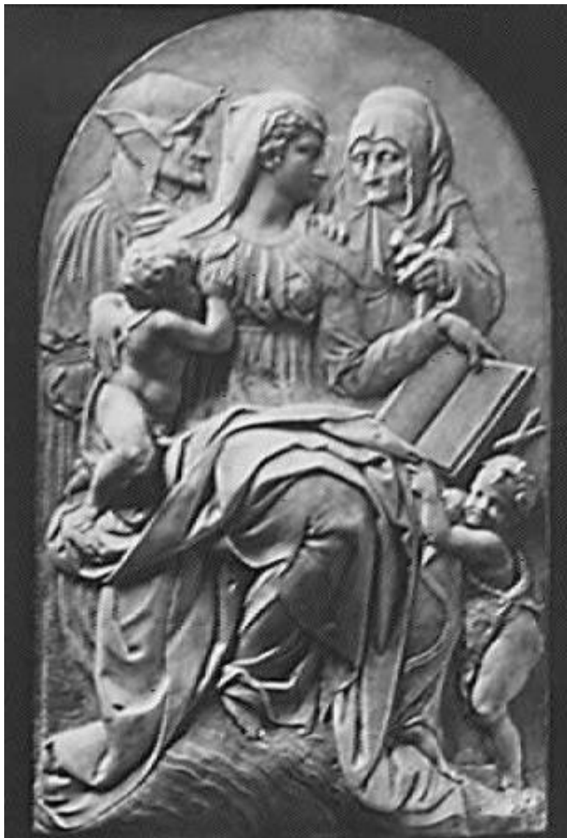
ATTRIBUITO A PIER FRANCESCO DI BARTOLOMEO DETTO PIERINO DA VINCI (1530 CA.-1554) MADONNA COL BAMBINO, SAN GIOVANNINO, SANTA ELISABETTA E SAN GIUSEPPE O GIOACCHINO BASSORILIEVO IN MARMO, CM 42x27 17336-58[186]