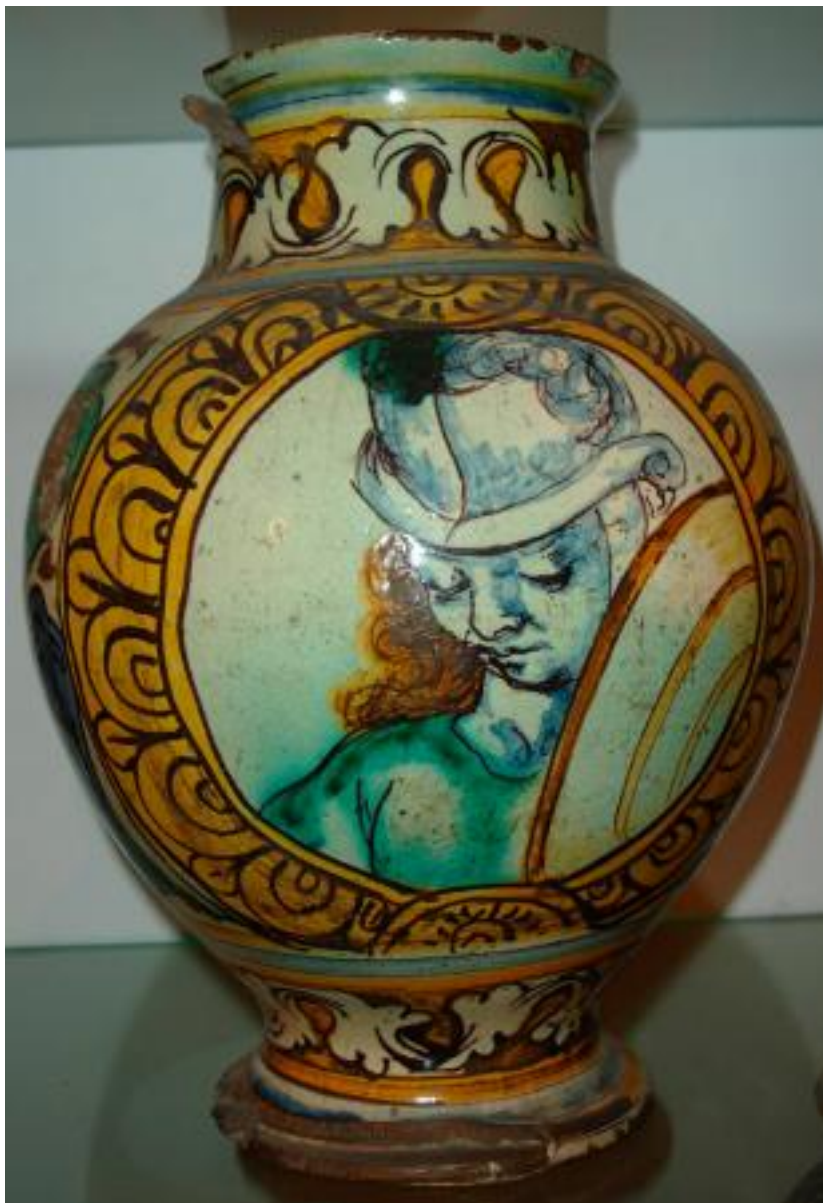
XV SECOLO VASO GLOBULARE IN MAIOLICA, CM 27 93036[5]