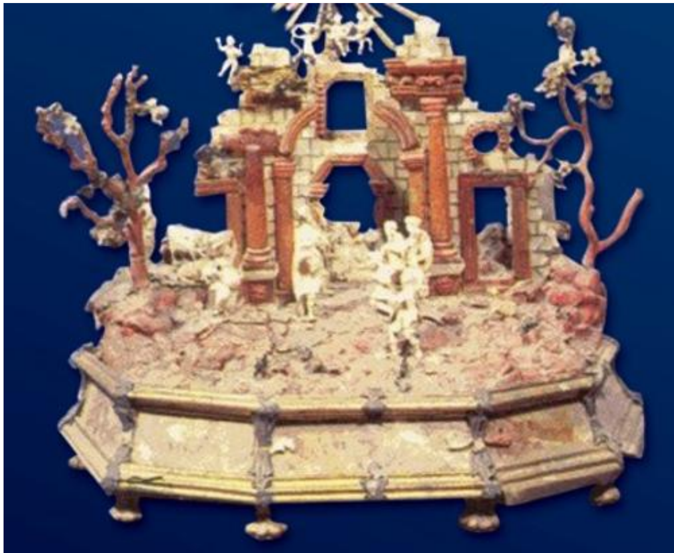
XV SECOLO L'ADORAZIONE DEI PASTORI GRUPPO SCULTORE IN ARGENTO, RAME, AGATA, CORALLO, MADREPERLA E AVORIO, CM 42x37x24 25743[1]