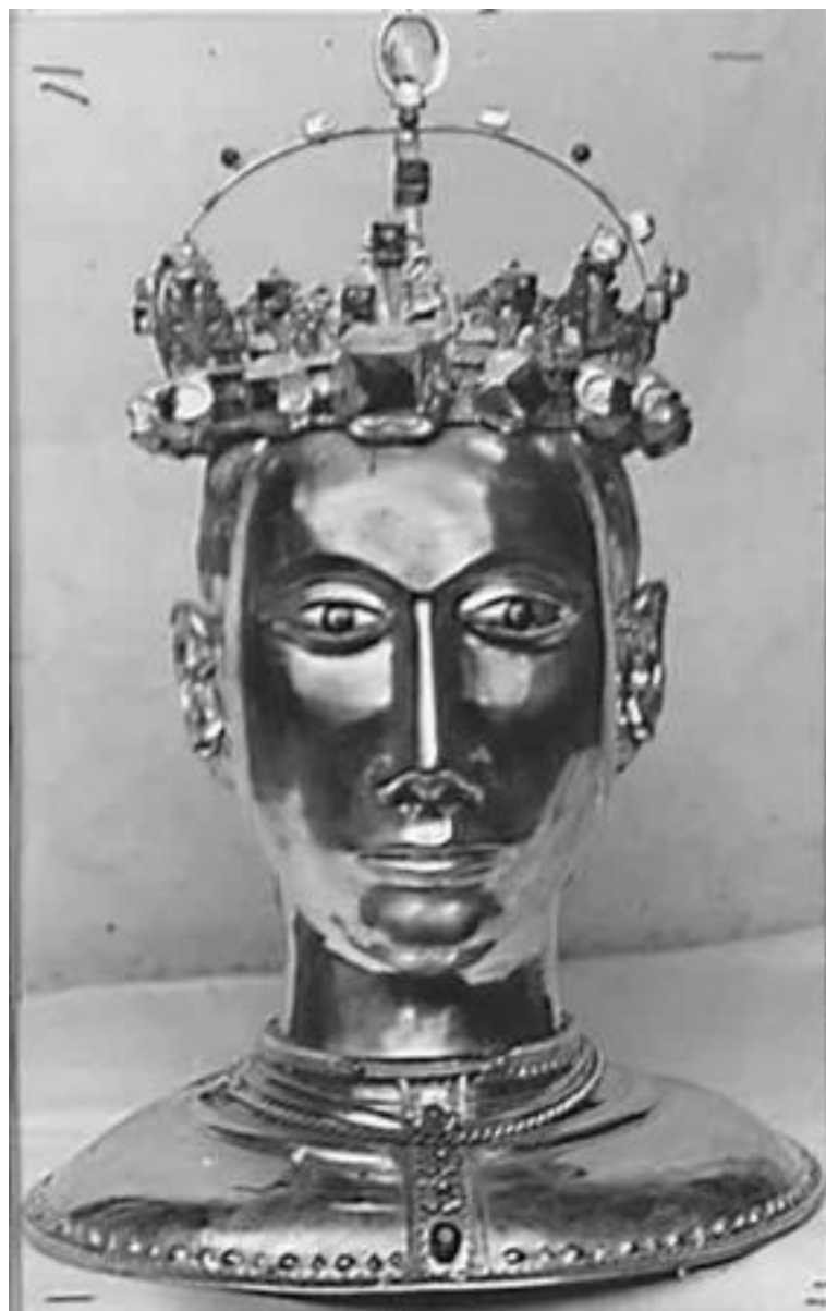
XV SECOLO BUSTO RELIQUIARIO DI SAN GIULIANO ARGENTO SBALZATO 02499[2]