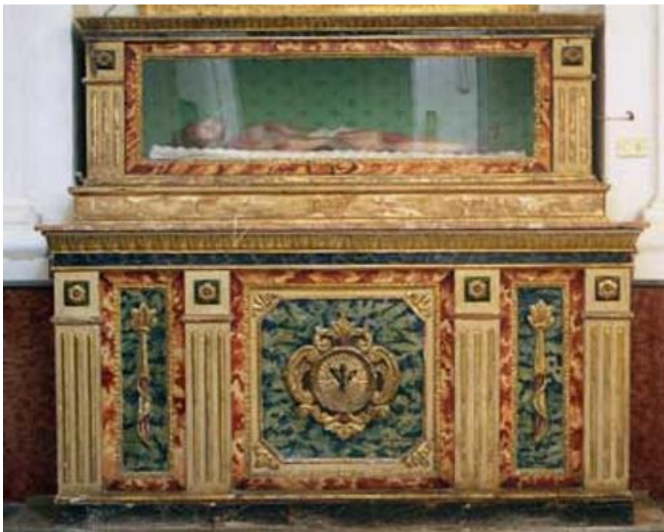
ANONIMO DEL XIX SECOLO ALTARE LATERALE IN LEGNO DIPINTO CON RIQUADRI LEGNO INTAGLIATO, CM 190x208 155433[10]