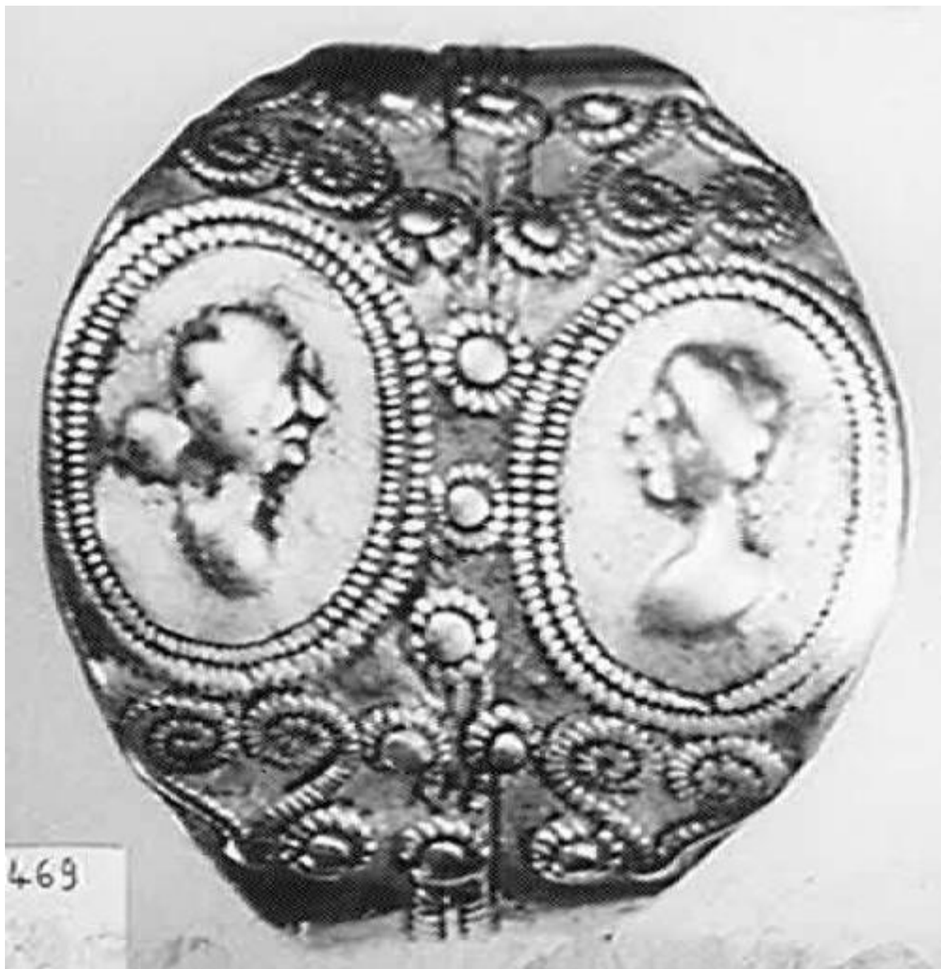
III SECOLO D.C. ANELLO NUZIALE LAMINA IN ORO, CM 1 11565[4]