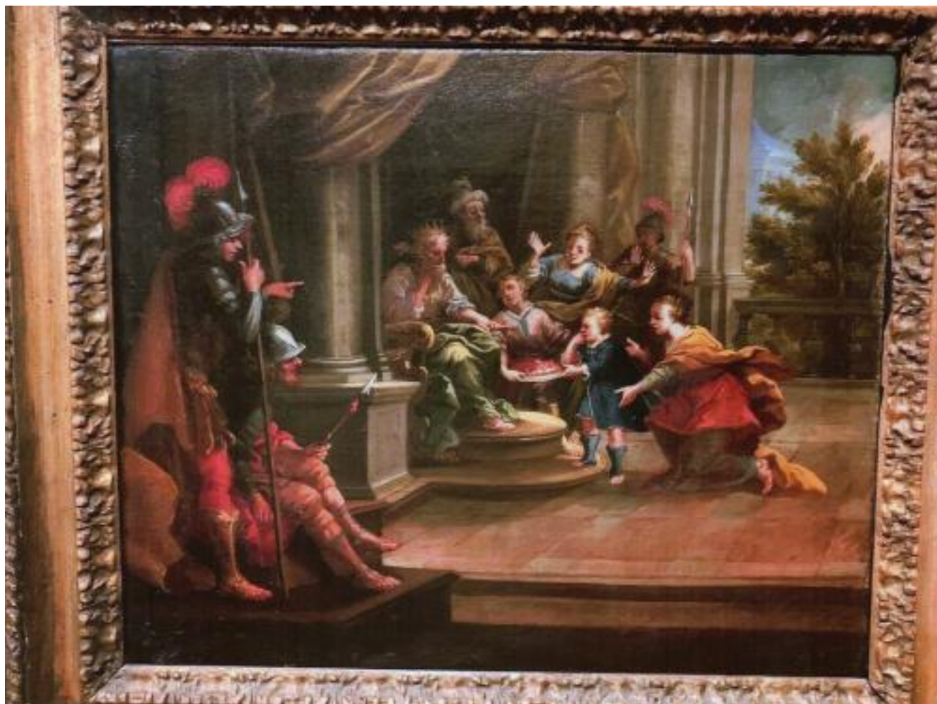
ANONIMO DEL XVIII SECOLO LA FAMIGLIA DI DARIO DAVANTI AD ALESSANDRO MAGNO DIPINTO OLIO SU TELA, CM 35x43 153174[4]