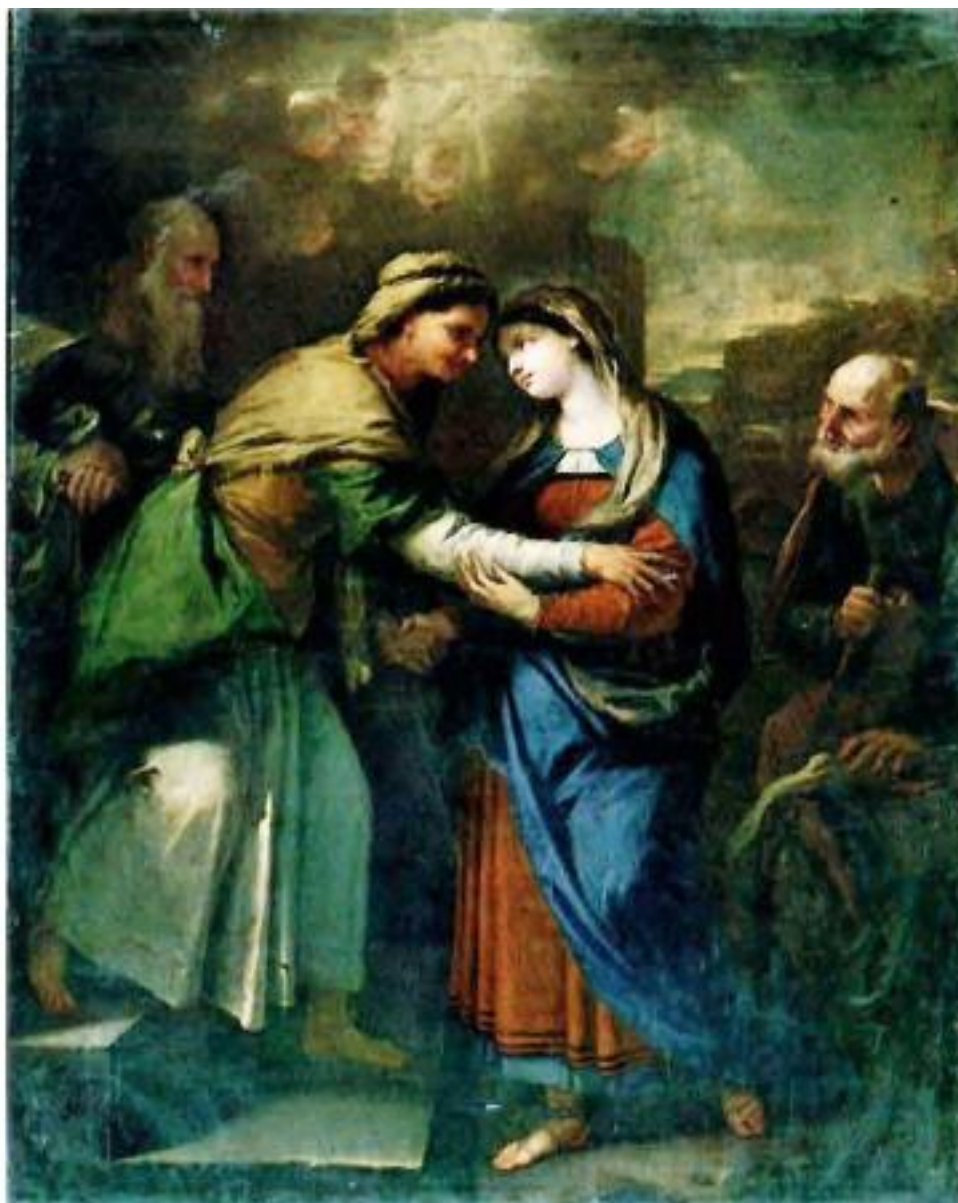
LUCA GIORDANO (1634-1705) LA VISITAZIONE OLIO SU TELA, CM 209x167 28457[1]