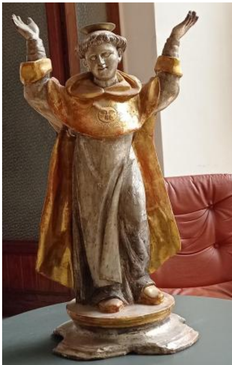
XIX SECOLO SAN TOMMASO D'AQUINO STATUA IN CARTAPESTA, CM 53x30 154277[1]