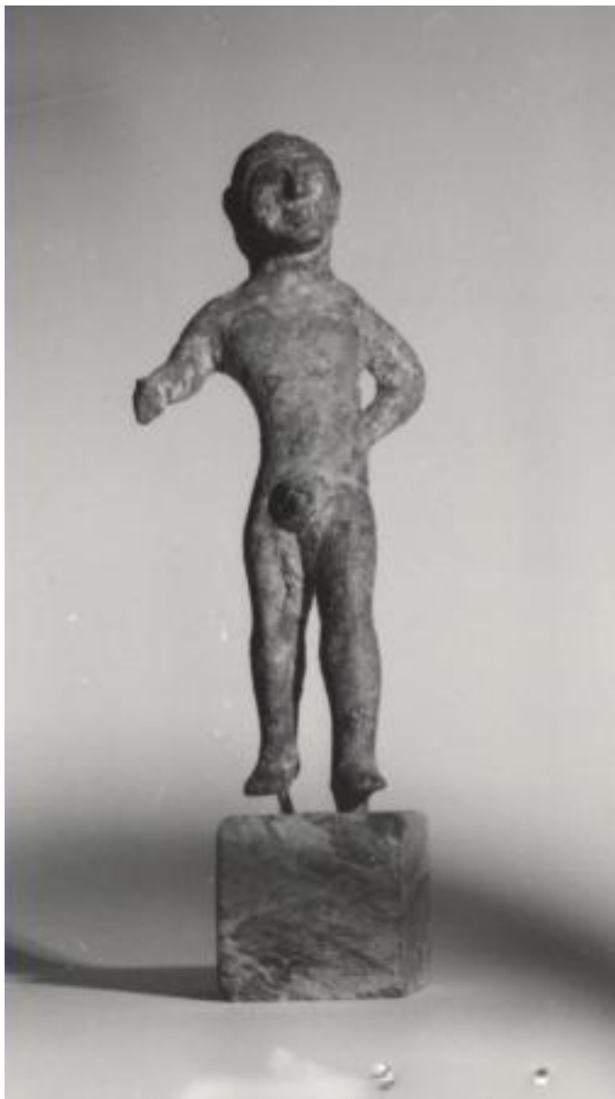
VI - IV SECOLO A.C. BRONZETTO ETRUSCO ITALICO RAFFIGURANTE KOUROS CON MANO SUL FIANCO BRONZO, CM 10 00247[7]