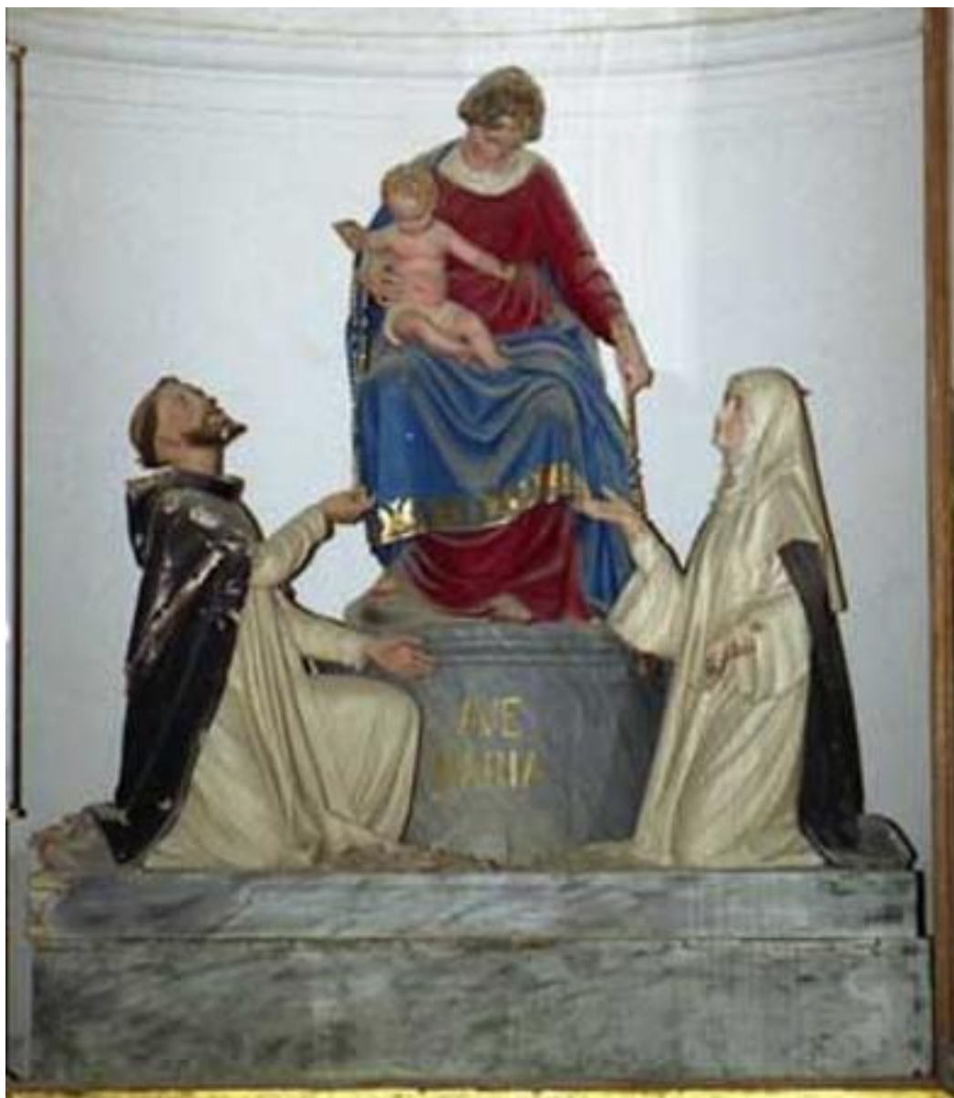
XX SECOLO MADONNA DEL ROSARIO GRUPPO SCULTOREO IN LEGNO E CARTAPESTA, CM 140x75 155433[8]