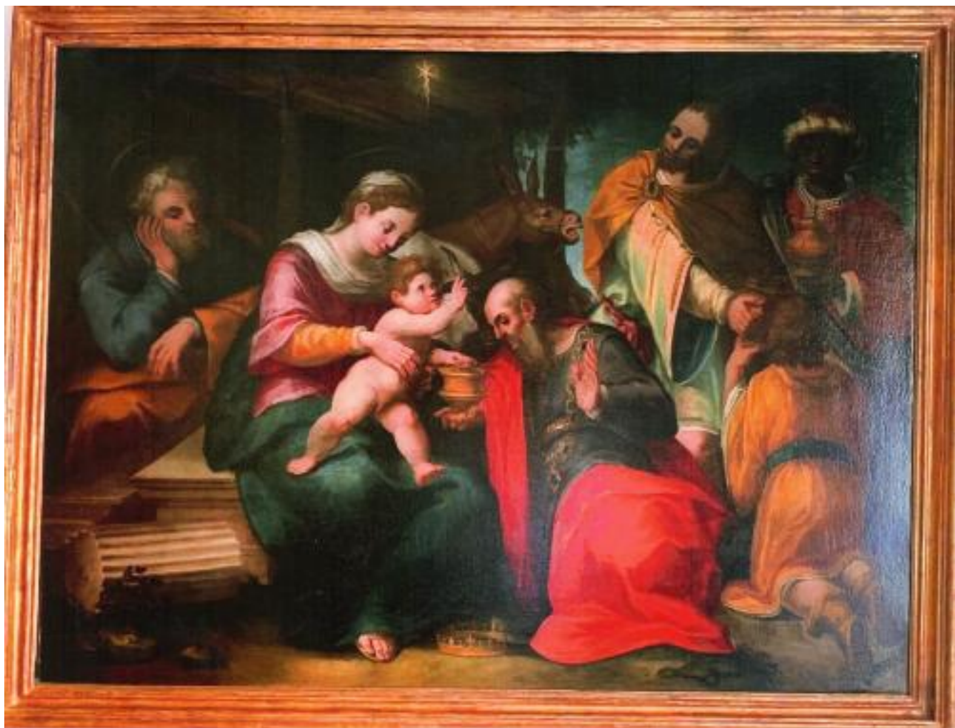
ANONIMO DEL XVIII SECOLO ADORAZIONE DEI MAGI DIPINTO OLIO SU TELA, CM 98x134 153174[3]