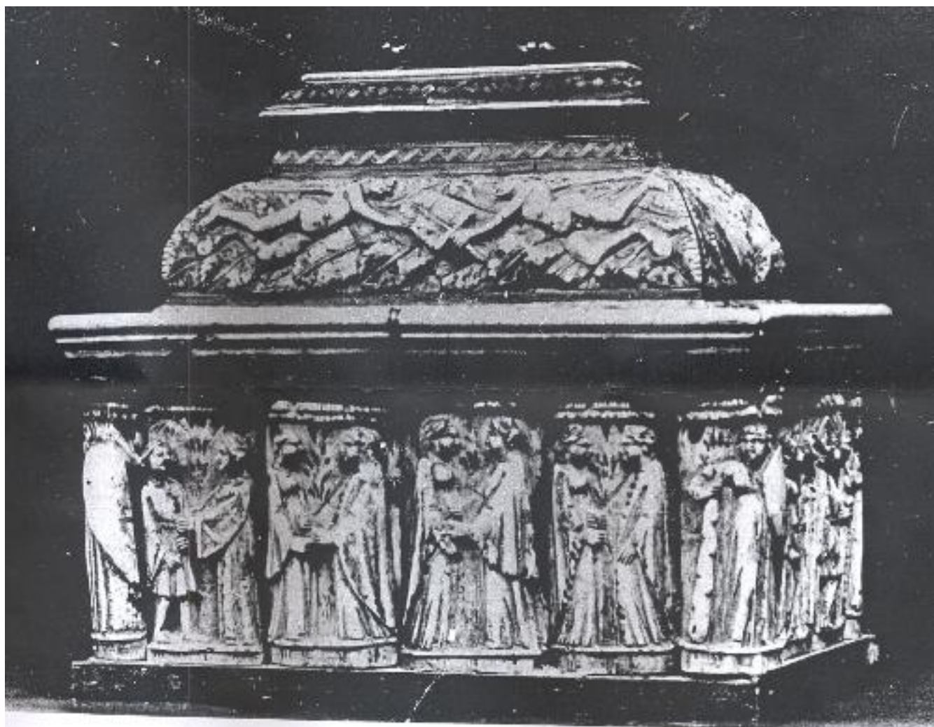
XV SECOLO COFANETTO NUZIALE DELLA BOTTEGA DEGLI EMBRIACHI EBANO E AVORIO, CM 19x17x12 88862[1]