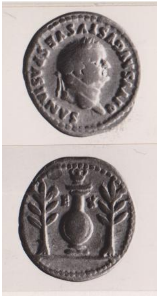
88-89 D.C. AUREO COMMEMORATIVO DI VESPASIANO BATTUTO DA TITO - RIC II 358 ORO 94151[297]