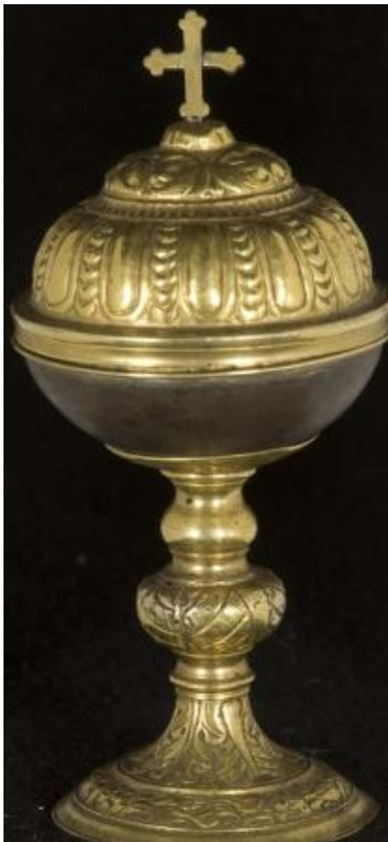
BOTTEGA LOMBARDO-PIEMONTESE DEL XV SECOLO PISSIDE DA VIATICO CON CROCE APICALE FUSIONE DI BRONZO E RAME, CM 14x7 99914[7]