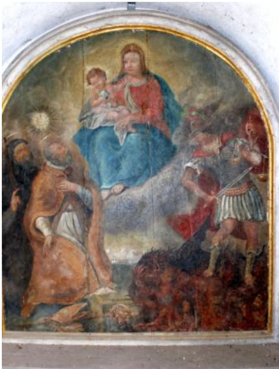
ANONIMO DEL XVIII SECOLO MADONNA COL BAMBINO, SAN MACARIO E SAN MICHELE ARCANGELO CHE UCCIDE IL DRAGO DIPINTO SU TELA, CM 150x150 154693[1]