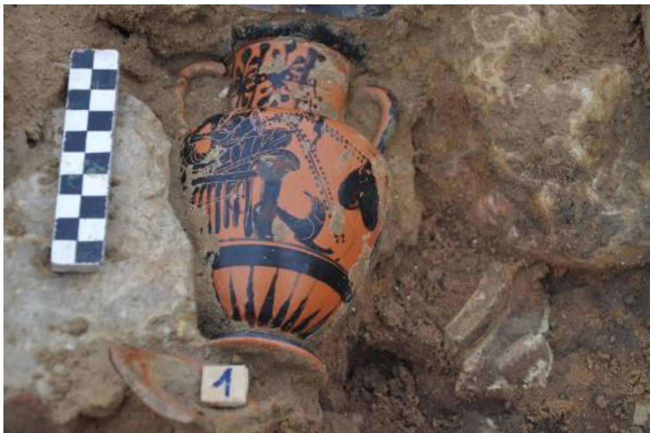
SECONDA META' DEL VI SECOLO A.C. ANFORA ARRICA A FIGURE NERE RAFFIGURANTE DIONISIO SU KLINE ARGILLA, CM 20 98844[1]