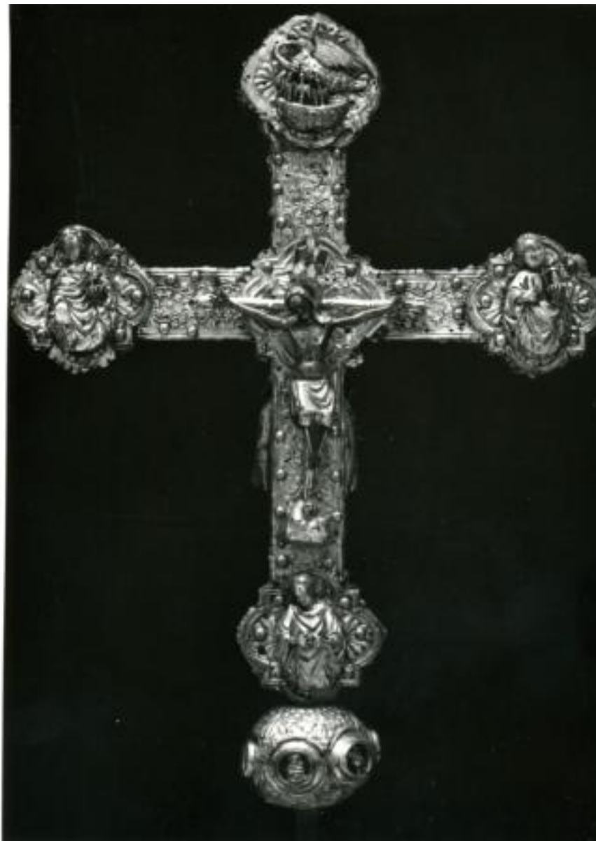
XV SECOLO CROCE ASTILE ARGENTO CESELLATO, CM 67x47 05614[1]