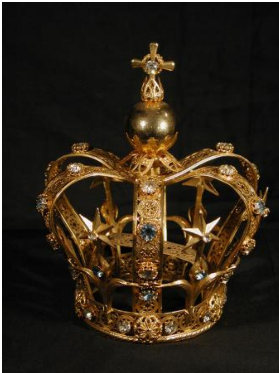
BOTTEGA FIORENTINA DEL XX SECOLO CORONA DEL BAMBINO GESU' DI PRAGA FOGLIA D'ORO E OTTONE, CM 15x8 101012[1]