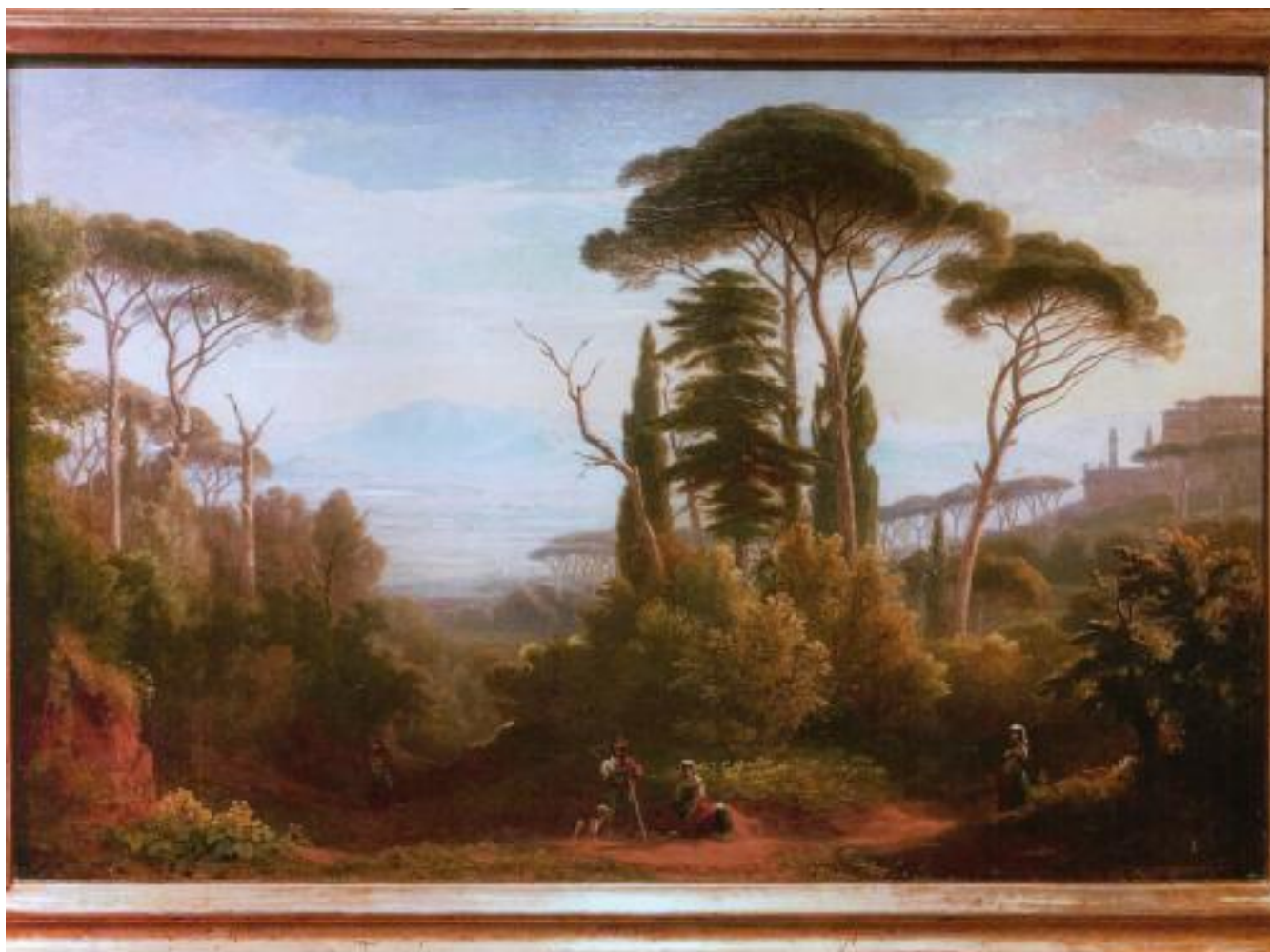
ANONIMO DEL XVIII SECOLO PAESAGGIO BOSCHIVO CON FIGURE DIPINTO OLIO SU TAVOLA, CM 32x41 153174[5]