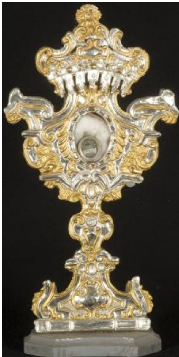
BOTTEGA LOMBARDO-PIEMONTESE DEL XVI SECOLO RELIQUIARIO A OSTENSORIO DI SAN BERNARDO RAME, LEGNO E RAME, CM 39x19x9,5 99914[8]