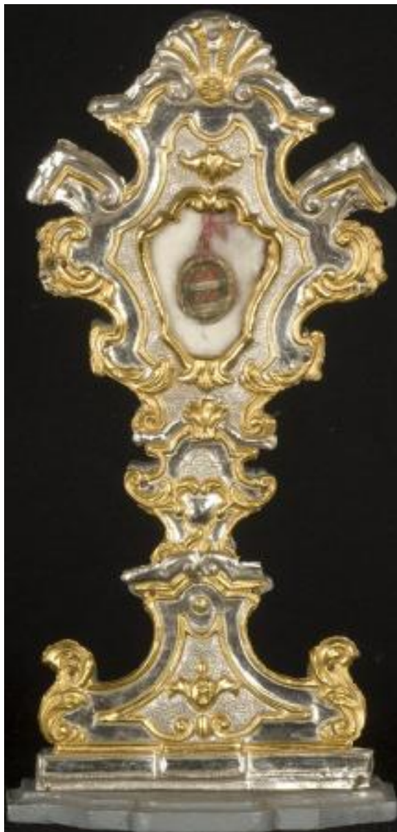
BOTTEGA LOMBARDO-PIEMONTESE DEL XVI SECOLO RELIQUIARIO A OSTENSORIO DI SAN GIORGIO E SAN ROCCO ROME, LEGNO E VETRO, CM 35x16x10 99914[10]