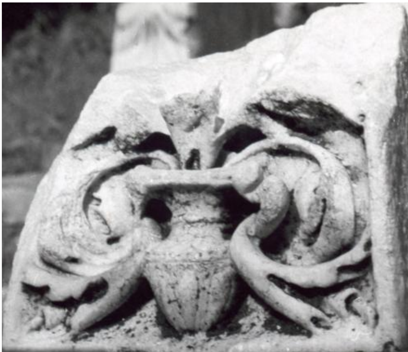
I - II SECOLO D.C. FRAMMENTO DI ANTEFISSA MARMOREA RAFFIGURANTE VASO BACCELLATO DA CUI ESCONO GIRALI DI ACANTO MARMO, CM 45x25 00170[1]