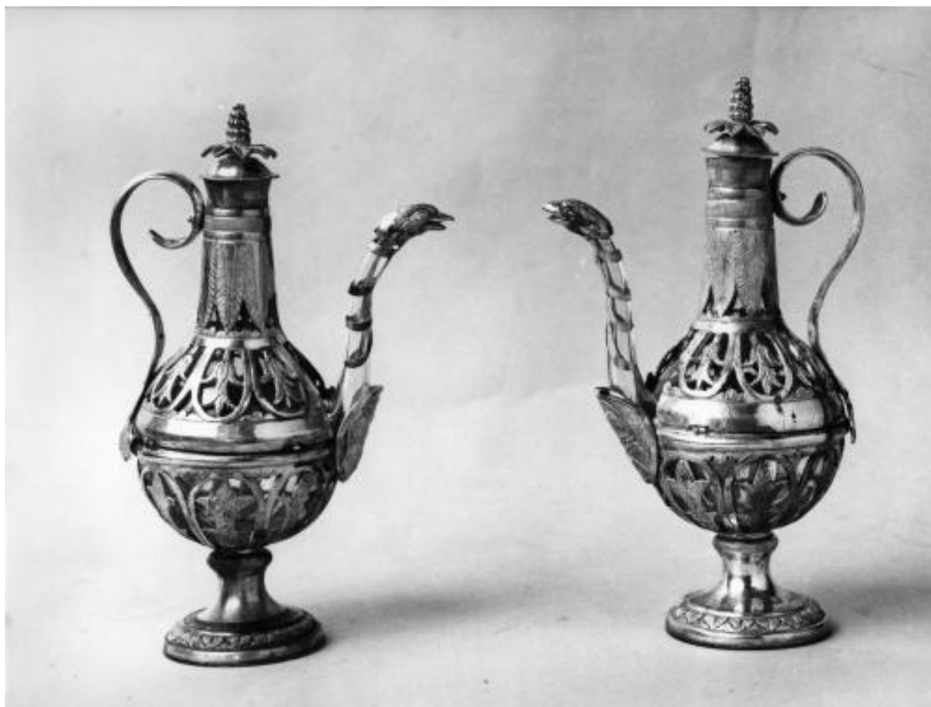
ANONIMO DEL XIX SECOLO COPPIA DI AMPOLLINE REALIZZATE IN ACIREALE 12 AGOSTO 1837 ARGENTO SBALZATO E CESELLATO, CM 19 153424[14]