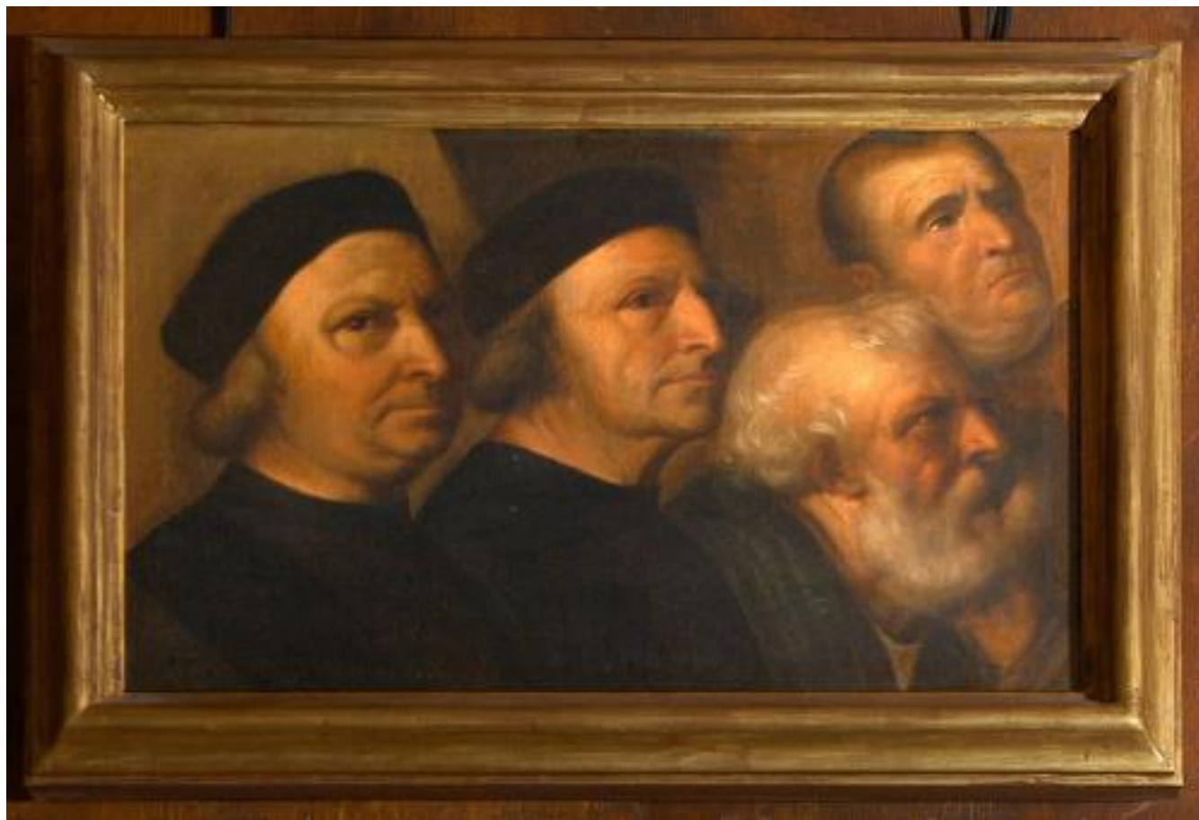
SEBASTIANO RICCI (1659 - 1734) LA PRESENTAZIONE DIPINTO OLIO SU TELA, CM 40x68 154308[9]