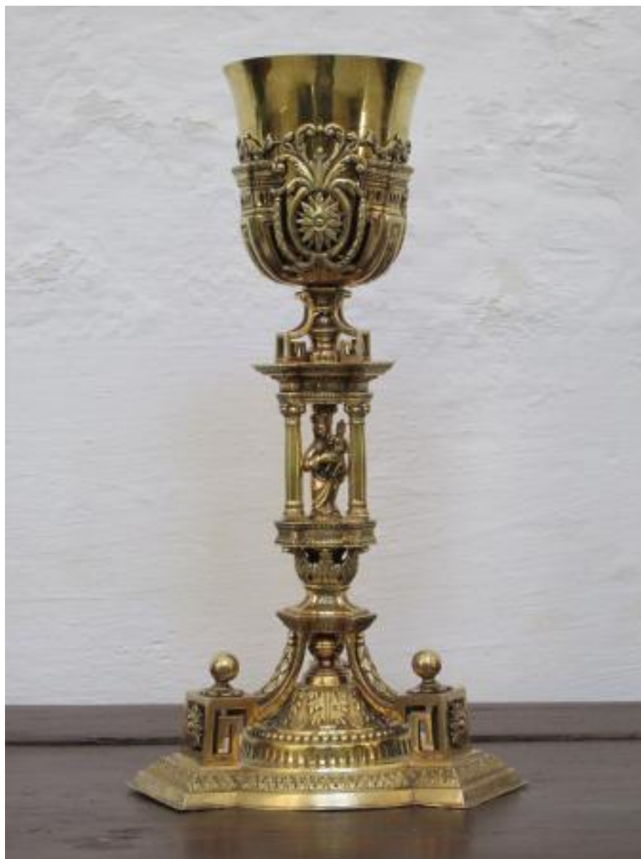
ANONIMO DEL XIX SECOLO CALICE REALIZZATO IN ACIREALE 12 AGOSTO 1837 ARGENTO CESELLATO, CM 29X14 154338[1]