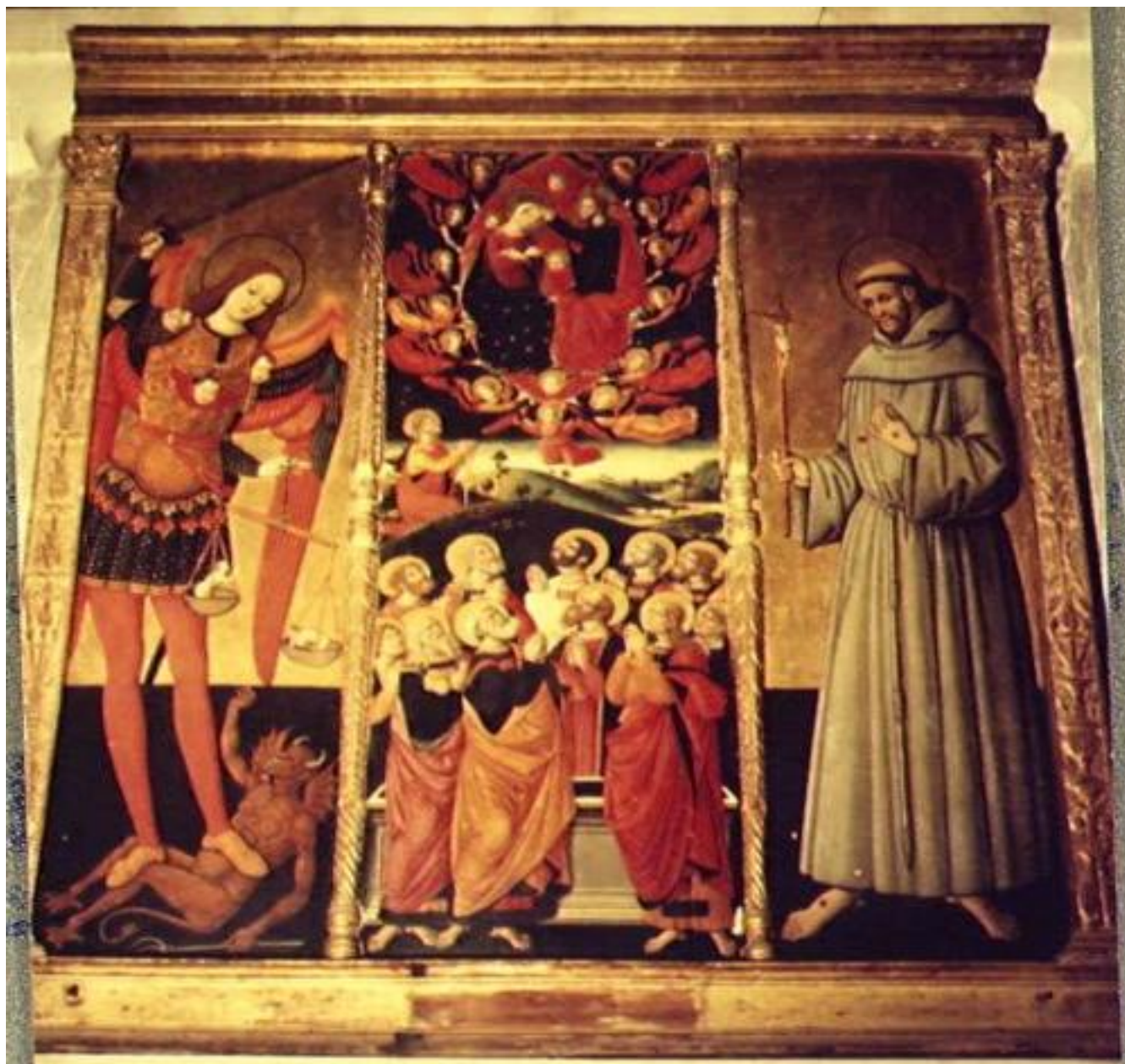
ANONIMO DEL XV SECOLO INCORONAZIONE DELLA VERGINE TRITTICO TEMPERA SU TAVOLA, CM 150x140 16163[1]