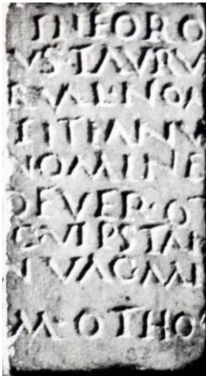
58-68 D.C. FRAMMENTO DEGLI "ACTA FRATRUM ARVALIUM" MARMO, CM 7x5 00398[1]