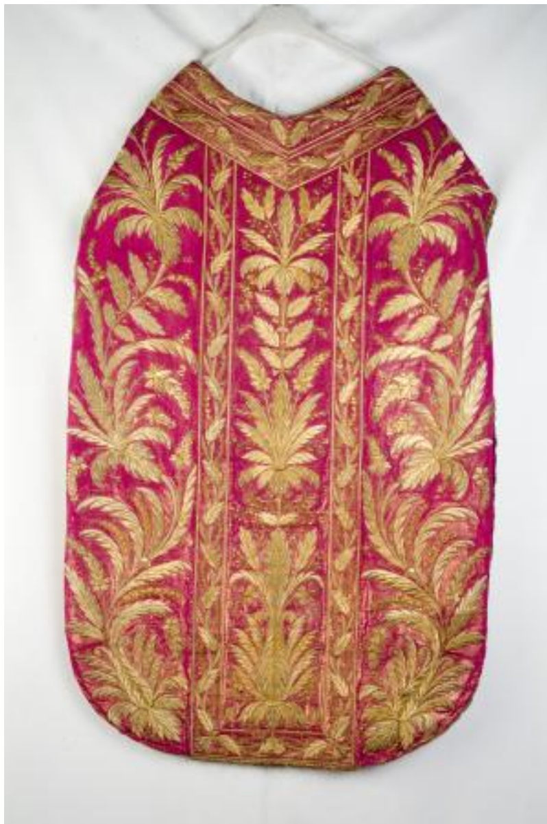
XVIII - XIX SECOLO PIANETA GROS DE TOURS CANNELLATO DI SETA ROSSA LAMINATO IN ORO, CM 110x72 92790[3]