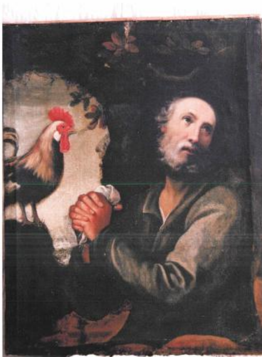
ANONIMO DEL XVII SECOLO SAN PIETRO APOSTOLO CON GALLO DIPINTO OLIO SU TELA, CM 98x78 152778[1]