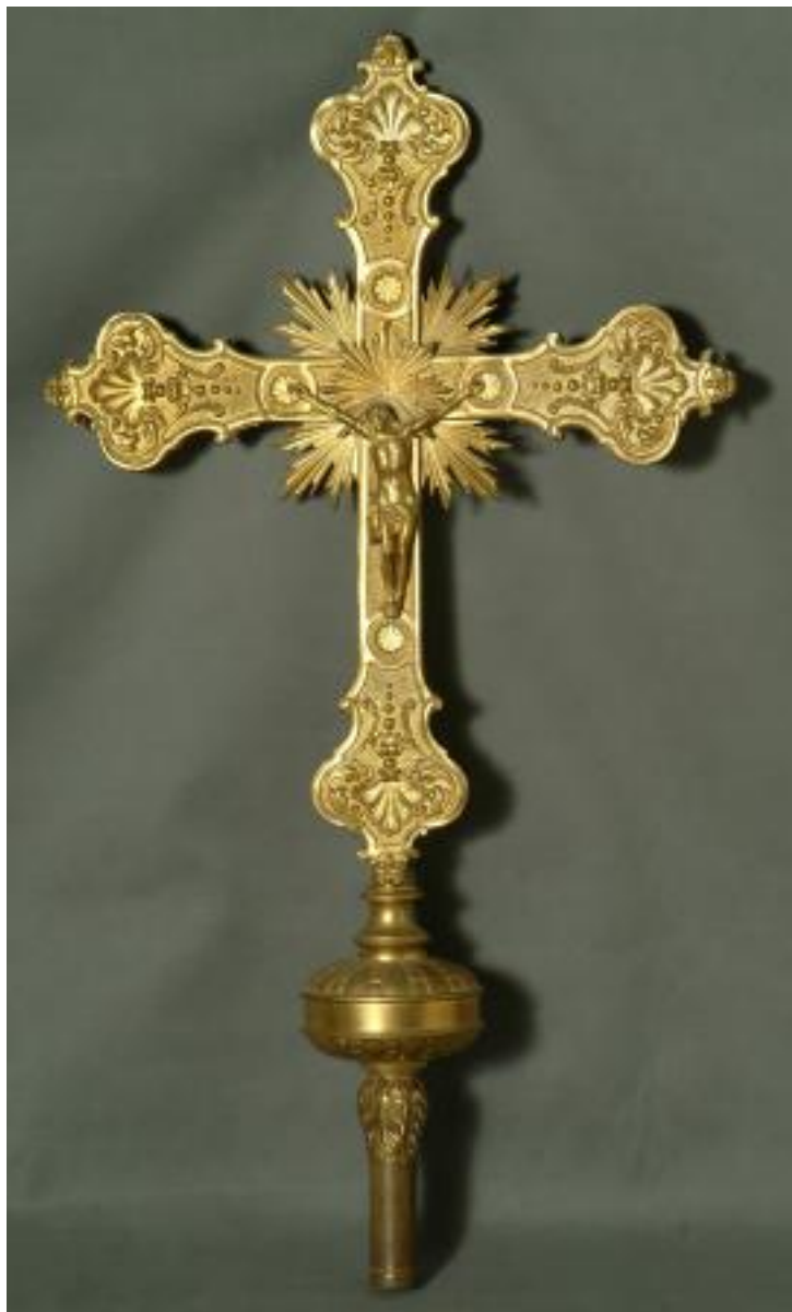
XIX SECOLO CROCE ASTILE IN LAMINA DI METALLO LEGNO E FUSIONE DI METALLO E OTTONE, CM 85x47 154966[1]