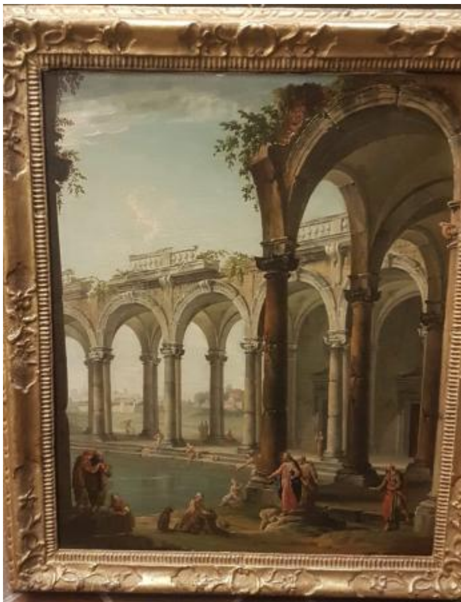
ANTONIO JOLI (1700 - 1777) LA PISCINA DI BETSABEA DIPINTO OLIO SU TELA, CM 76.5x64 154719[6]