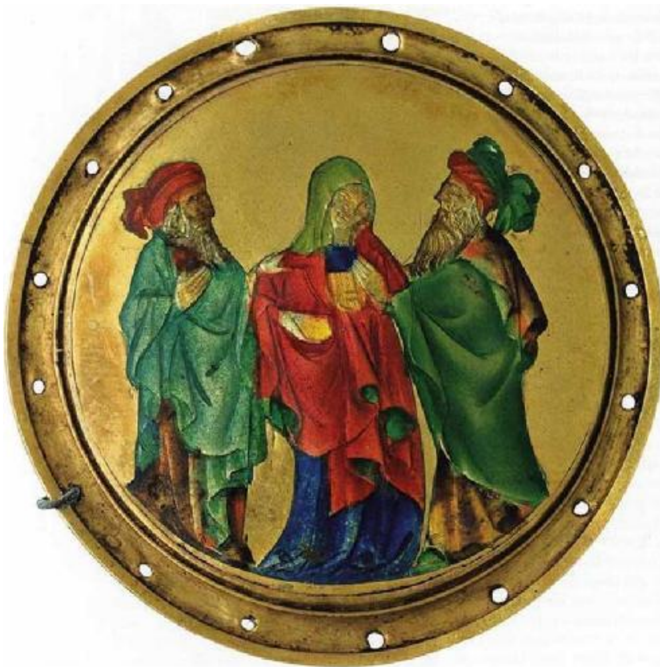
XIV SECOLO CIONDOLO ORO E SMALTO, CM 47 115489[3]