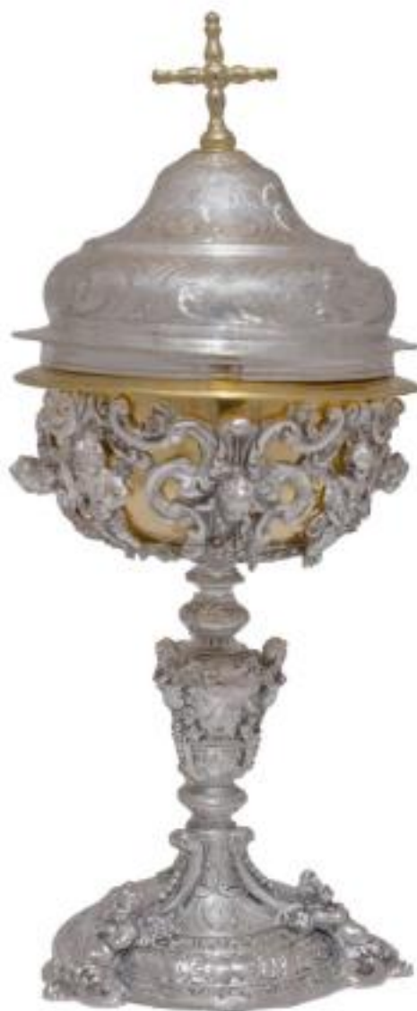
XVIII SECOLO PISSIDE A TRAFORO PARTENOPEO ARGENTO, CM 29 147438[11]