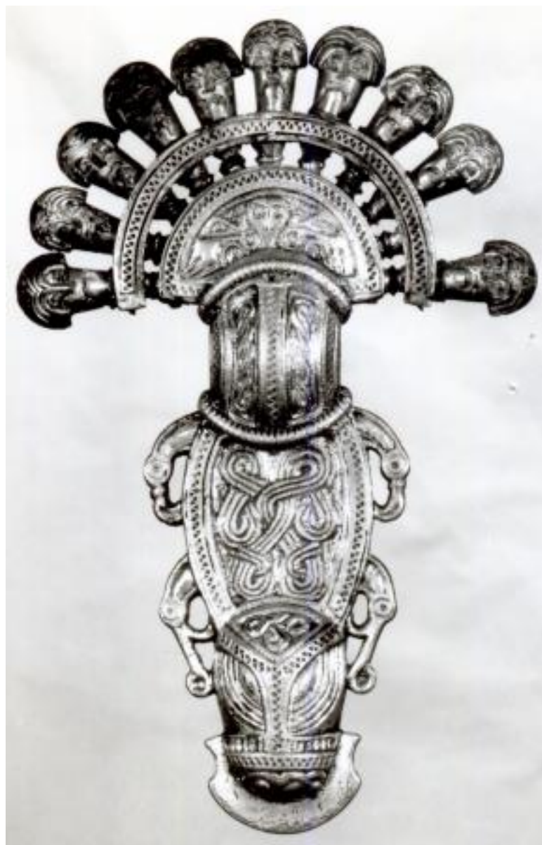
II - VI SECOLO D.C. FERMAGLIO ARGENTO 121272[2]