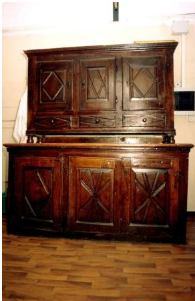
XVIII- XIX SECOLO ARMADIO DA SACRESTIA LEGNO , CM 240x179x93 97905[1]