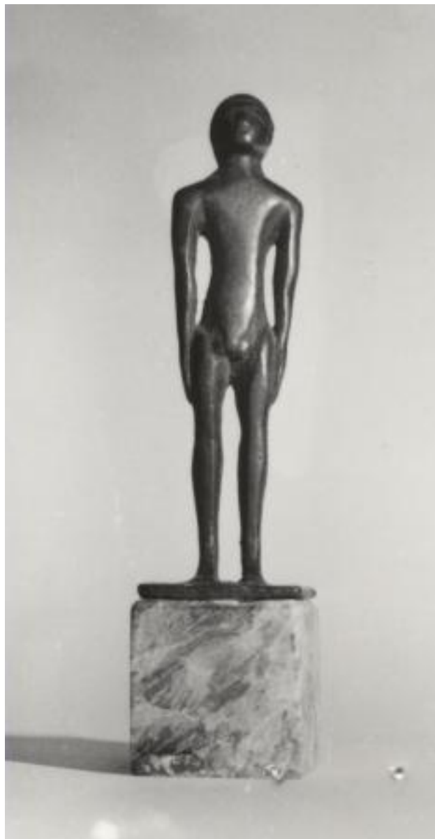
VI - IV SECOLO A.C. BRONZETTO ETRUSCO ITALICO RAFFIGURANTE KOUROS CON BRACCIA ADERENTI BRONZO, CM 10 00247[8]