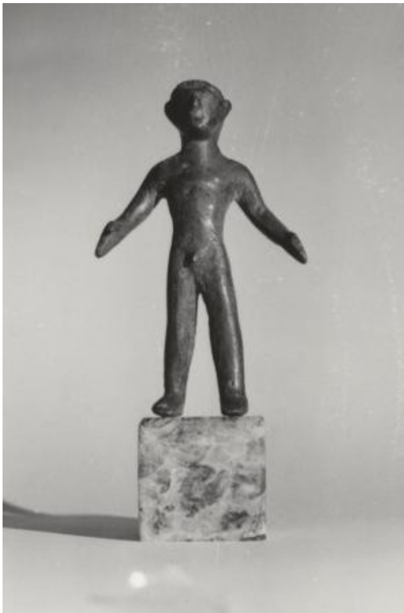
VI - VI SECOLO A.C. BRONZETTO ETRUSCO ITALICO RAFFIGURANTE KOUROS BRONZO, CM 9 00247[4]